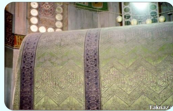
مرقد حضرت ابراهیم علیه السلام

در وسط هیکل سلیمان فضایی مطهر وجود داشت که به آن قدس الاقداس می‌گفتند و تابوت عهد خداوند در آنجا قرار داشته است. این مکان محل حضور دائمی خدایی است که معبد متعلق به اوست.