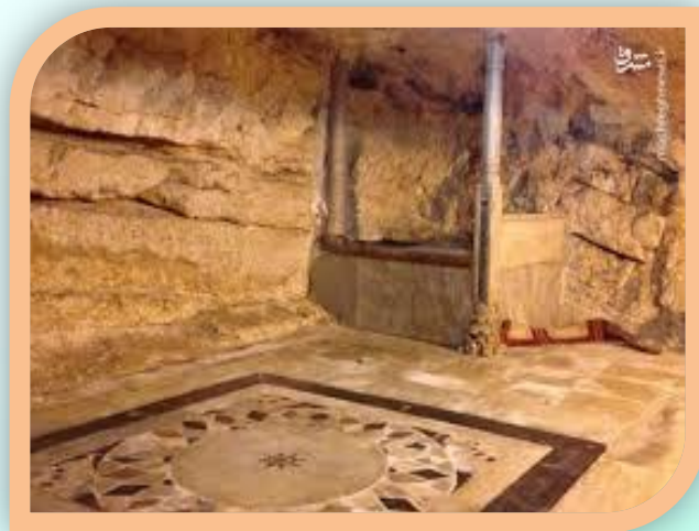
محل معراج حضرت رسول اکرم صلی الله علیه و آله

اگر قدس در این سفر مورد توجه ویژه‌ای نبود معراج به طور مستقیم از مکه به آسمان هم ممکن بود همچنان که قرآن و احادیث هم به این امر دلالت دارند.