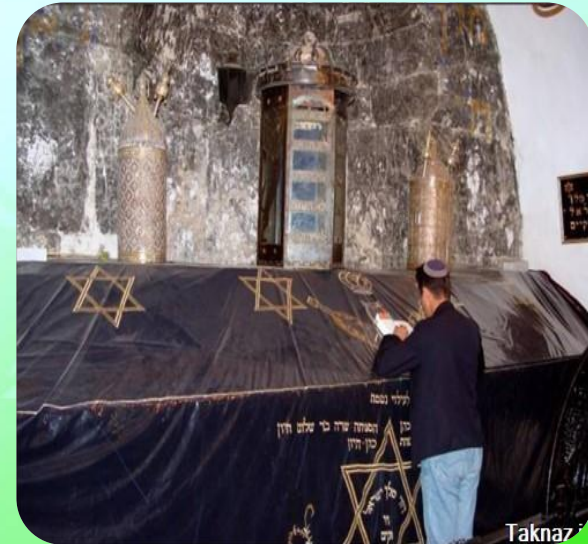
مرقد حضرت داوود علیه السلام