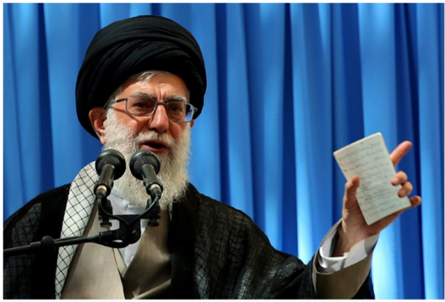
آمریکا امضا کرد:

به خدا سوگند، هر ملتی که درون خانه خود مورد هجوم قرار گیرد، ذلیل خواهد شد. (نهیج البلاغه خطبه ۲۷)